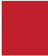
Tornadorot Metallic (27A)